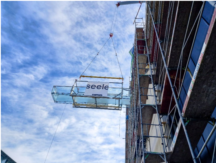
Mit dem gläsernen Skywalk setzt Bründl Sports einen architektonischen Akzent in Kaprun.