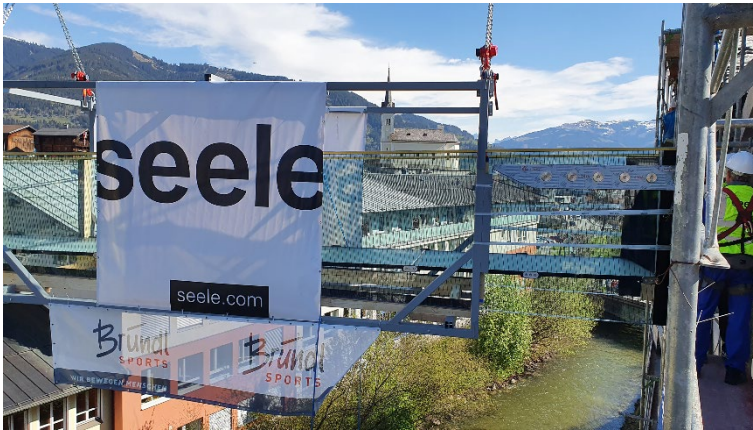
In 15m Höhe demontieren die Monteure von seele nach der Fixierung des Glasstegs den Montagerahmen.